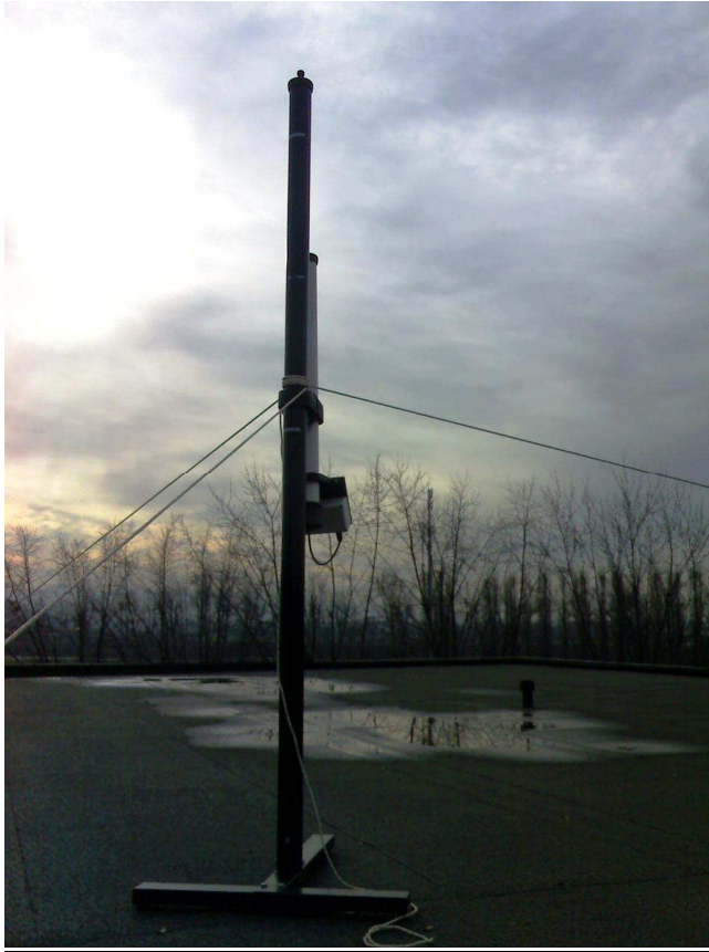
Figura 1 – Foto della centralina sul tetto piano della scuola rispetto all'antenna.

massimo del valore medio trascinato (RMS) per ciascun giorno di misura e l'istante in cui si è verificato. Dove non espressamente indicato, tutti i valori riportati sono medie trascinate (RMS).